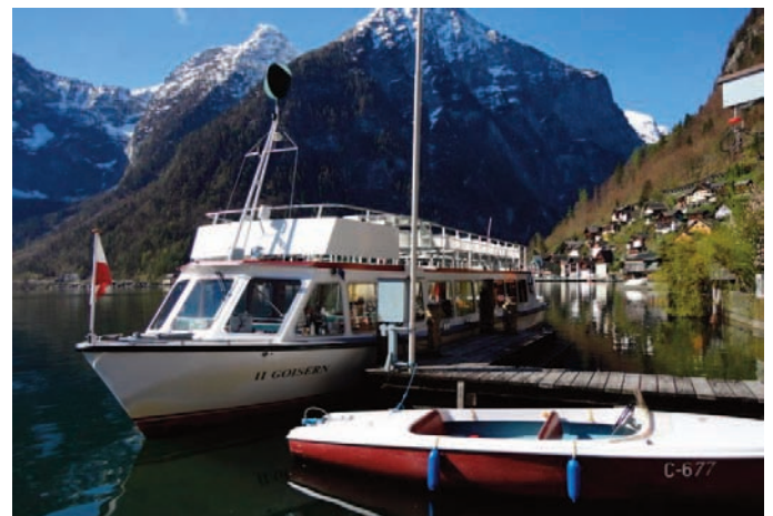
Motorschiff GOISERN II

Am 14. November übernahm die Firma K.u.K. Hemetsberger die Schifffahrt auf dem Hallstättersee und betreibt sie bis heute. Die Linie Hallstatt – Markt ist die einzige Schiffsverbindung auf einem