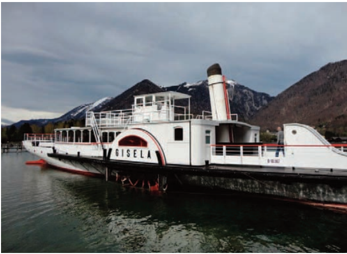
Raddampfer GISELA in Rindbach.

und das Prunkstück, der Raddampfer GISELA erhält einen neuen Hecksalon aus Buchenholz. Wir wünschen der Firma Karlheinz Eder steigende Passagierzahlen und eine gute Saison!