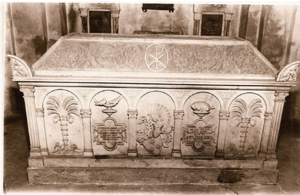
Krypta der Marinekirche mit dem Sarkophag.