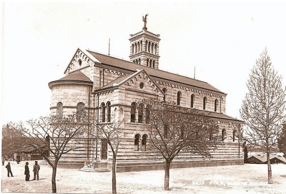
Pola, Marinekirche, Ostseite.

ihm gegründete Kirche „Madonna del Mare“ steht. Der Sarg Sternecks sank in die Gruft des Marinefriedhofes, der Generalmarsch ertönte, die Regiments- und Marinekapelle intonierten die Volkshymne, die Dechargen der ausgerückten Garnison erfolgte und das Stationsschiff HABSBURG, das Hafenkastell und drei Festungen feuerten je drei Kanonenschüsse als letzte Ehre. Das 89. Begräbnis im Polesaner Marinefriedhof des Jahres 1897 war beendet. Leider geht aus Friedhofslisten nicht mehr die Urgrablage der Gruft hervor.