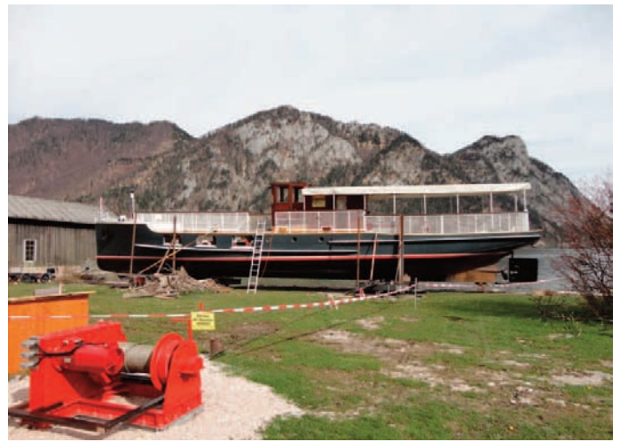
Motorschiff RUDOLF IPPISCH an Land.

und das Prunkstück, der Raddampfer GISELA erhält einen neuen Hecksalon aus Buchenholz. Wir wünschen der Firma Karlheinz Eder steigende Passagierzahlen und eine gute Saison!