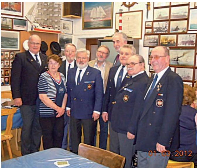
Der neue Vorstand wurde einstimmig gewählt.

Am 1. März versammelte sich unsere Marinekameradschaft zu ihrer diesjährigen Hauptversammlung im Bordlokal im Stadtteil Osarn.