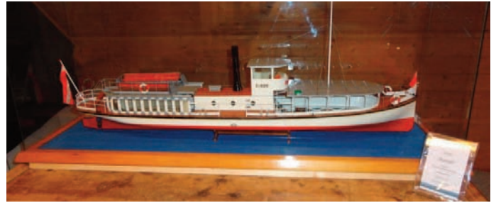
Modell der RUDOLF.

1930 begann auch auf dem Hallstättersee das „Motorboot – Zeitalter“ durch den Einsatz des Motorbootes HALLSTATT III und sieben Jahre später stellte Karl Hemetsberger nach dem Erhalt einer Konzession das Motorboot OBERTRAUN-DACHSTEIN-HÖHLEN in den Schifffahrtsdienst. Nach dem Zweiten Weltkrieg wurden die