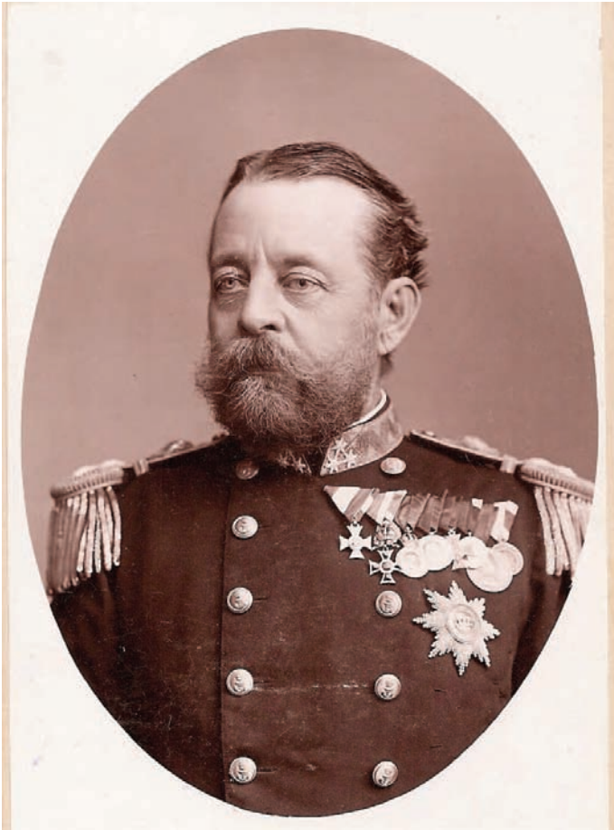
Admiral Maximilian Daublebsky von Sterneck.

Als der Marinekommandant Admiral Maximilian Freiherr Daublebsky von Sterneck am 5. Dezember 1897 in Wien starb, konnte er sein Lebenswerk die Marinekirche in Pola nicht mehr vollendet sehen. Er wurde zwar wunschgemäß in Pola, aber zunächst nicht in der Marinekirche „Madonna del Mare“ bestattet. Die Grundsteinlegung der Kirche erfolgte am 28. Juni 1891 im Polesaner Stadtteil St. Policarpo, aber nach mehrjährigem Bau konnte erst am 2. Dezember 1898 die Einweihung der Kirche vorgenommen werden.