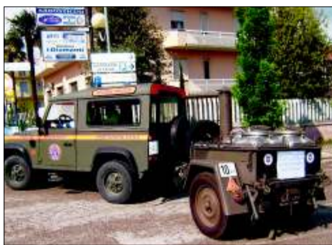
„Gespendet von den österreichischen an die Marinekameraden von Montesilvano“ steht am Schild.